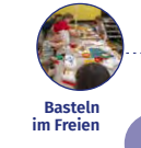
Basteln im Freien